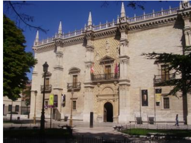
Palacio de Sta Cruz-Rectorado