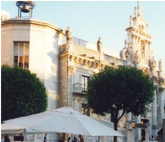
Fachada de la facultad de Derecho, en la Pza. de la Universidad