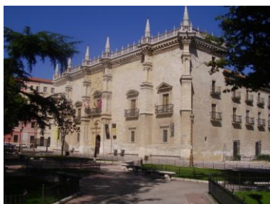
Plaza Sta. Cruz