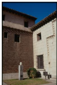
Casa Museo de Colón

Más museos y más información en: www.ava.es (en Ciudad de Valladolid-Cultura) o en www.valladolidturismo.com y en los periódicos de la ciudad.